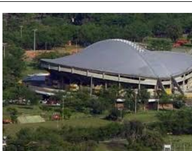
Coliseo "El Pueblo", Carrera 52 calles 2 y 3 – Cali, Colombia.